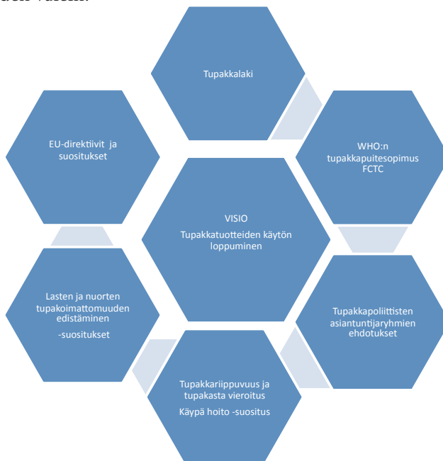
Kuvio 1. Toimenpideohjelman tausta

Toimenpideohjelma arvioidaan, raportoidaan ja päivitetään vähintään viiden vuoden välein.